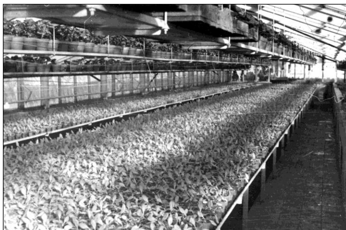
Hrnkované sazenice hlávkového salátu Zlatý rekord připravené k výsadbě do hangáru v novém zahradnictví v Brumově (cca 20tisíc kusů).