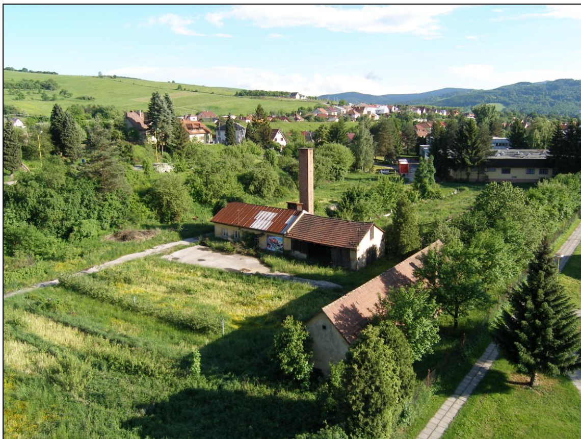
Torzo “nového“ zahradnictví v květnu 2013 – před výstavbou Penny marketu.

Ve firmě Semo Smržice, jsou výrazně vlídnější, ale moc nadějí na využití mi nedávají. A tak toto „rodinné stříbro“ asi zůstane zapomenuto a skončí se tak jedna epizoda ryzí rostliny.